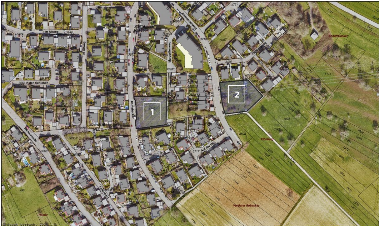
Abb. 1: Lageplan der Flurstücke, die für eine Energiezentrale in Frage kommen (M1:2000)